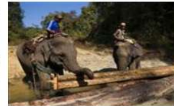
ミャンマーの最大都市ヤンゴン郊外で伐採した丸太を動かす象【拡大】

ミャンマーは、期限付きの森林の伐採禁止措置が話題となっている。1年間の期限付き伐採禁止については昨年後半から浮上していたが、ミャンマー木材会社の幹部が「9割方実施されると思う」との見解を示した。現地紙ミャンマー・タイムズが報じた。