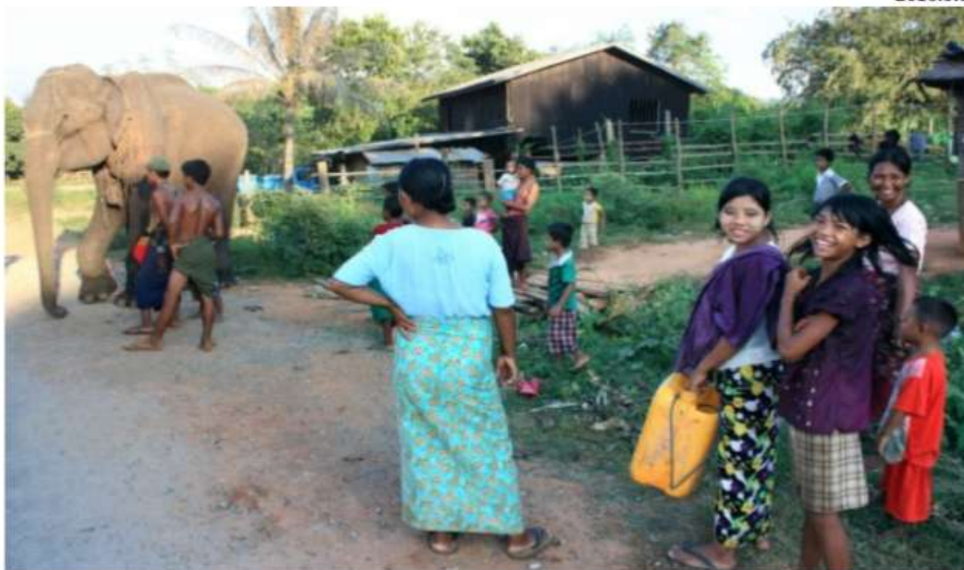
農村では徘徊する象の姿をよく見かける