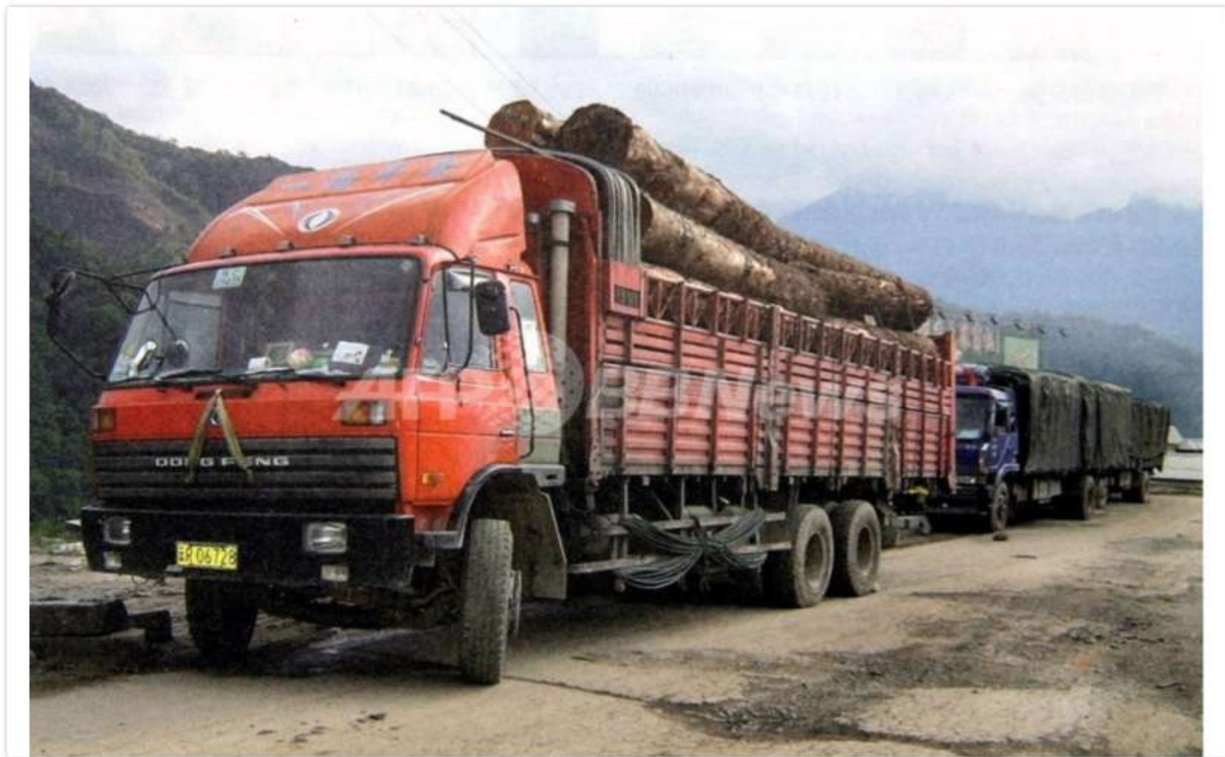
違法伐採監視組織Global Witnessが2005年10月18日公開した、ミャンマーのPian Maから中国の雲南（Yunnan）省へ材木を運ぶトラック（2004年撮影）。