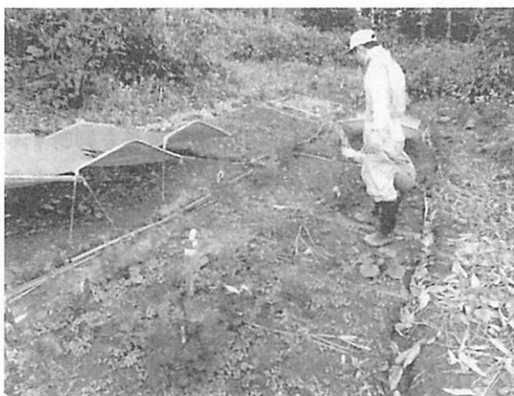
写真一 蛇紋岩土壤の苗木の様子

2009年7月末に携帯型赤外線光合成蒸散測定装置(LI6400, LI-COR社製)を用いて、光を十分に当てた状態での純光合成速度を測定しました。2009年9月上旬に植栽時からのF 1 の生残率、乾燥重量を測定しました。収穫した苗木の針葉および土壤に含まれる窒素、ニッケル、マグネシウムの濃度を測定しました。土壤に関してはpHおよび含水率の測定も行いました。