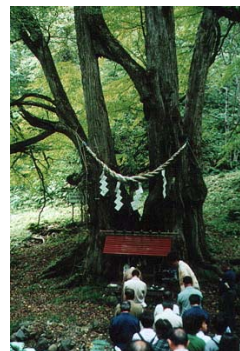
図3. 乙部町の縁桂 上部丸の部分が癒合していることから「縁」があり、長寿であることから神前結婚が行われる。

の例では、春の花の時期には、年間30万人近い「集人力」を持ち、森林レクリエーションと地域活性化に貢献している(図4)。厳しい自然の中で生き抜いてきた巨樹・巨木に、美しさや畏敬を見出し、それらを保全することは、また、私も樹木医学を学び森林美学を講じる者の目標である。