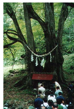
図3. 乙部町の縁桂 上部丸の部分が癒合していることから「縁」があり、長寿であることから神前結婚が行われる。HPより

の例では、春の花の時期には、年間30万人近い「集人力」を持ち、森林レクリエーションと地域活性化に貢献している(図4)。厳しい自然の中で生き抜いてきた巨樹・巨木に、美しさや畏敬を見出し、それらを保全することは、また、私も樹木医学を学び森林美学を講じる者の目標である。