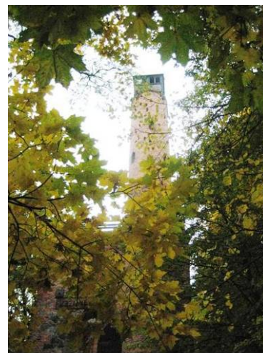
写真—8 Johanna の観測塔 ザーリッシュの父が 1850 年に建 設。現在、Milicz 森林管理署が維持。

このあと 昼食と夕食を 兼ねた会がポ ステリン近郊 のレストラン で開催され、 ポーランドの 郷土料理を頂 き、感動の一 日を終えた。 絵画の一部を 見るような森 づくりの理由