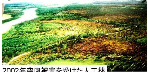
2002年突風被害を受けた人工林

ーランド航空を利用し、乗り継ぎも含め札幌から約23時間後、ようやくポズナン空港へ降り立った。翌日、会場のポーランド森林文化センターへ到着すると、ヨーロッパらしいお茶会の出迎えであった。失礼ながら、もっと貧しい印象を持っていたが、領主の城跡を利用してできたセンターであることも手伝って、実に豊かな雰囲気であった。