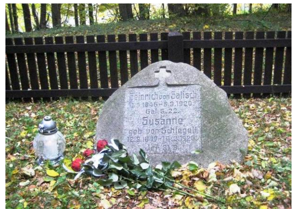
写真-3 ザーリッシュの墓標へのお参り

続いて、私は全く予期していなかったザーリッシュの林内の墓地へお参りすることになった。出発時、ドイツの教授達が正装していた理由がようやくわかった。こんなことであれば、せめてネクタイくらいは用意しておくべきだった。途中、森林管理事務所へ寄って歓迎を受け、所長らが同行してきたが、この時に花束やランタン様のお参り道具を積み込んでいたのだった。